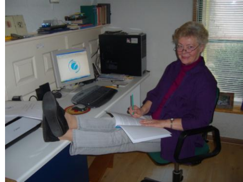
Het Cosbo secretariaat is gevestigd in Mildam