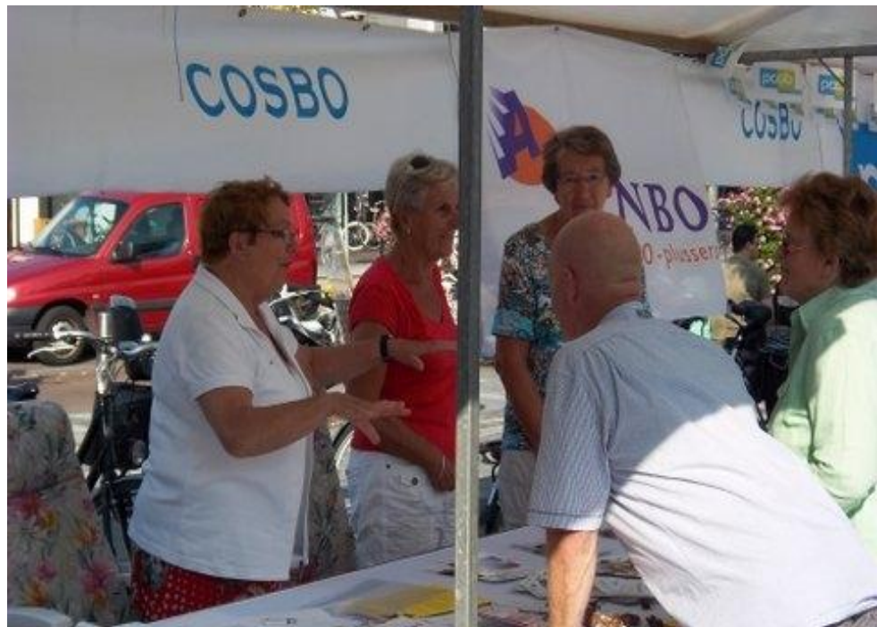
De bonden ANBO, PCOB en KBO gezusterlijk onder COSBO-vlag bijeën op de Seniorenbeurs

In 2011 wierpen diverse ontwikkelingen hun schaduw vooruit. De 'kanteling' en 'stapeling' van overheidsmaatregelen en hun gevolgen – waarover later meer – dupeerden (ook) ouderen. Zorgelijk, te meer daar zij niet meer als aparte doelgroep van gemeentebestuur gelden en dus buiten beeld raken. Het is goed dat het COSBO via zijn contacten betrokken en op de hoogte blijft en daarom met recht kan spreken namens de partners.